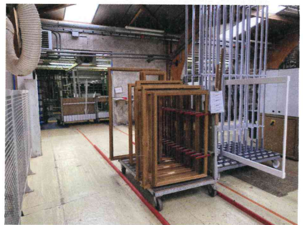
L'entreprise Pons produit entre 15 et 20 menuiseries par jour, « avec pour seul objectif de fabriquer et de proposer des menuiseries d'une excellente qualité au meilleur coût », comme le déclarent ses dirigeants.