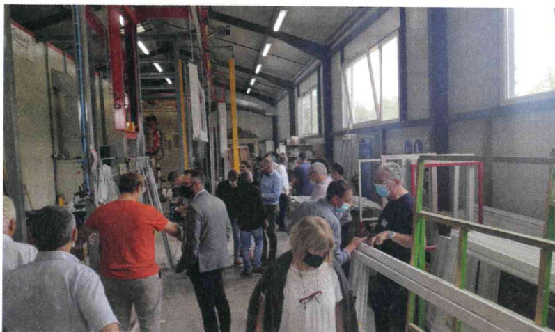
L'entreprise Portes et Fenêtres du Périgord, spécialisée dans la menuiserie sur-mesure, a été l'une des premières à s'engager dans la démarche de labellisation ProcimeUp.

« Nous sommes exclusivement fabricants », soulignent les deux dirigeants de l'entreprise, qui vend ses produits à des menuisiers poseurs, situés dans un